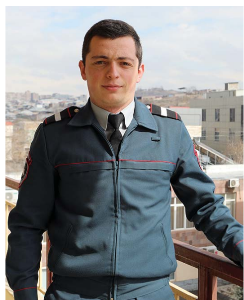
Քիչ հարցեր Պատասխանում ենք կարճ և արագ: